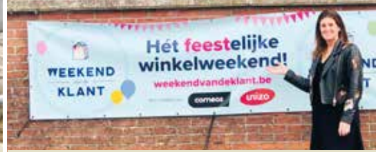
N-VA steunt lokale handelaars (p. 3)