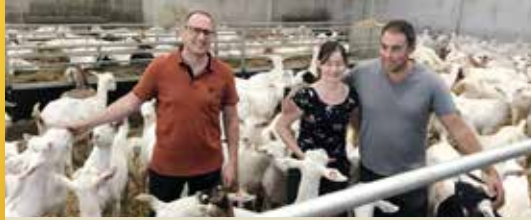
Vlaams Parlementslid Arnout Coel gaat de boer op (p. 2)