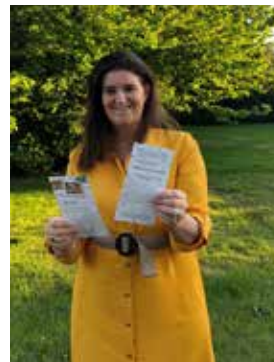
▲ Ondersteuning lokale handelaars.