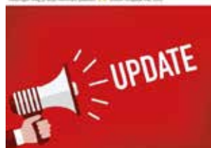
▲ Snelle communicatie tijdens de stormen.