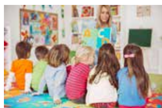
◀ Begin dit jaar zijn we gestart met een digitaal loket kinderopvang. Dat is een overzichtelijk platform voor ouders die op zoek zijn naar kinderopvang binnen Lubbeek. Daarnaast is het ook een nuttig beleidsinstrument.