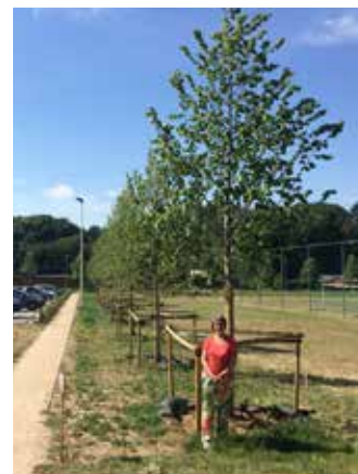
▲ Uw gemeentebestuur ging aan de slag met de resultaten van de bevraging bij de bevolking. We plantten lindebomen aan en zorgden voor een nieuwe bloemenweide in Linden-Centrum.