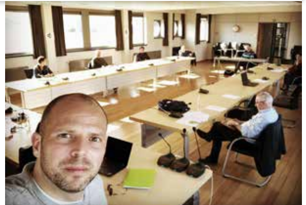
▲ Meerderheid én oppositie samen tegen corona.