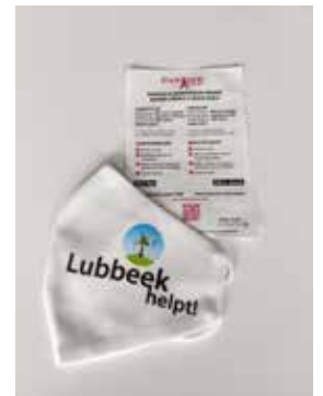
▲ Bedeling gratis mondklappers.