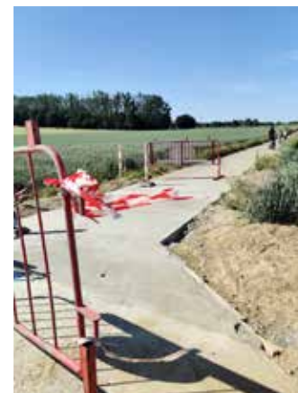
▲ De gemeente herstelde de straten die deel uitmaken van het fietsknooppuntennetwerk, waaronder de Rozemarijnweg.