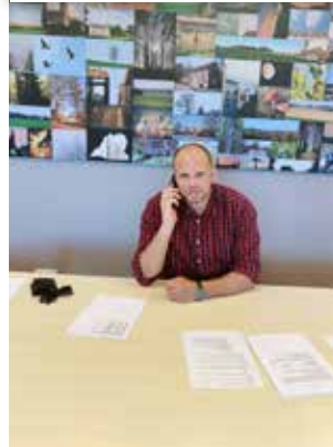
▲ 70-plussers werden opgebeld.