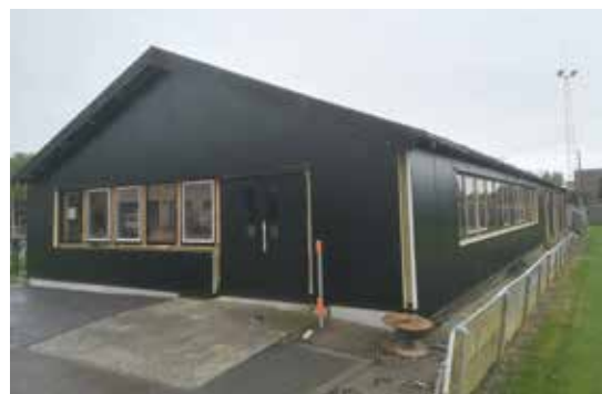
◀ Kantine Pellenberg

N-VA Lubbeek blijft investeren in een verkeersveilige en sportieve toekomst. De werken aan de Ganzendries en de sportkantine, beide in Pellenberg, zijn van start gegaan. Samen met de nutsmaatschappijen werd ook al de Tempelstraat in Linden heraangelegd.