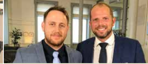
Arnout Coel legt eed af in Vlaams Parlement (p. 2)