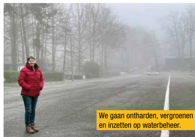
We gaan ontharden, vergroenen en inzetten op waterbeheer.