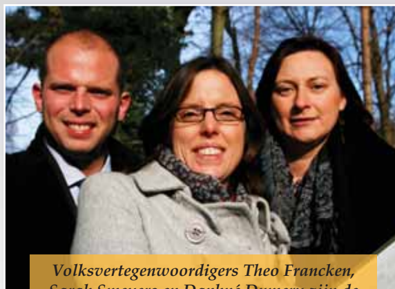
Volksvertegenwoordigers Theo Francken, Sarah Smeyers en Daphné Dumery zijn de N-VA-specialisten inzake asiel & migratie.

Voor N-VA-Kamerlid Daphné Dumery is het duidelijk: "Gezinsvorming en -hereniging, arbeids- en studentenmigratie, illegaliteit en regularisatie, vreemdelingen met tijdelijk verblijf, vrij verkeer van EU-burgers, erkende vluchtelingen, de verwerving van de nationaliteit ... elke schakel verdient een doordachte aanpak."